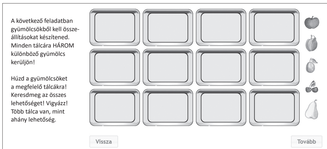
1. ábra: Példa egy képi feladatra

A felméréshez összeállított tesztek a korábban digitalizált feladatokból kerültek ki (CSAPÓ - PÁSZTOR, 2015). A feladatok megoldására felhasznált idő hasonló keretek között tartása érdekében a tesztek az 5-8. évfolyamokon hét feladatot, a 9-11. évfolyamokon nyolc feladatot tartalmaztak. A tesztek képi és formális feladatokból épültek fel, ugyanazokhoz a műveleti struktúrákhoz készültek különböző tartalmú feladatok. A képi feladatokra az 1. ábra, a formális feladatokra a 2. ábra mutat be egy példát. A válaszadás a képi feladatokban egérrel, az elemek mozgatásával ( drag-and-drop ), a formális feladatokban a billentyűzet használatával, jelek beírásával került sor.